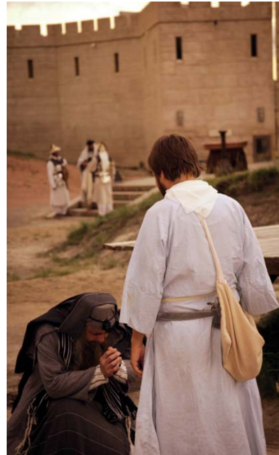
Um Vergebung bitten

Alle Artikel sind auch unter www.wkg.gci.org online nachzulesen!