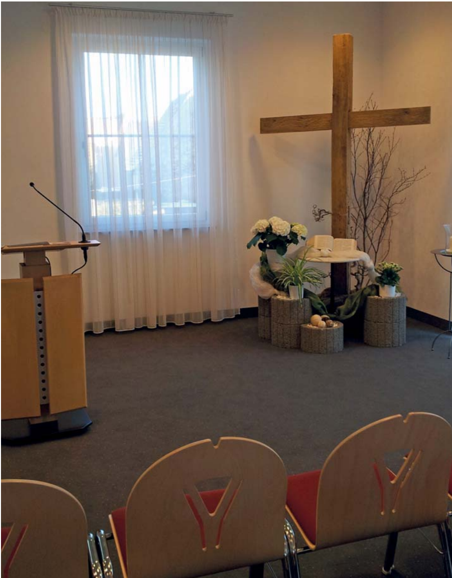
Versammlungsräume müssen hergerichtet und sauber gemacht werden.

Folgende wesentliche Punkte verstehen wir abgeleitet aus der Bibel in Bezug auf die geistlichen Gaben, die Gott seinen Kindern schenkt: