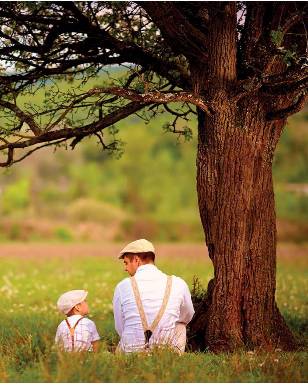
Der Heilige Geist ermöglicht uns die Beziehung mit Gott (unserem Vater) zu führen, für die wir geschaffen sind.

uns nur ein paar wenige Einblicke. Der Geist war bei der Erschaffung des Lebens anwesend (1. Mose 1,2; Hi 33,4; 34,14). Der Geist Gottes erfüllte Bezalel mit der Fähigkeit, das Tabernakel zu erbauen (2. Mose 31,3-5). Er erfüllte Mose und kam auch über die 70 Ältesten (4. Mose 11,25). Er erfüllte Josua mit Weisheit als Leiter, so wie Samson mit Stärke und der Fähigkeit zu kämpfen (5. Mose 34,9; Ri 6,34; 14,6). Der Geist Gottes wurde Saul gegeben und wieder genommen (1. Sam 10,6; 16,14). Der Geist gab David die Pläne für den Tempel (1. Chr 28,12). Der Geist inspi-