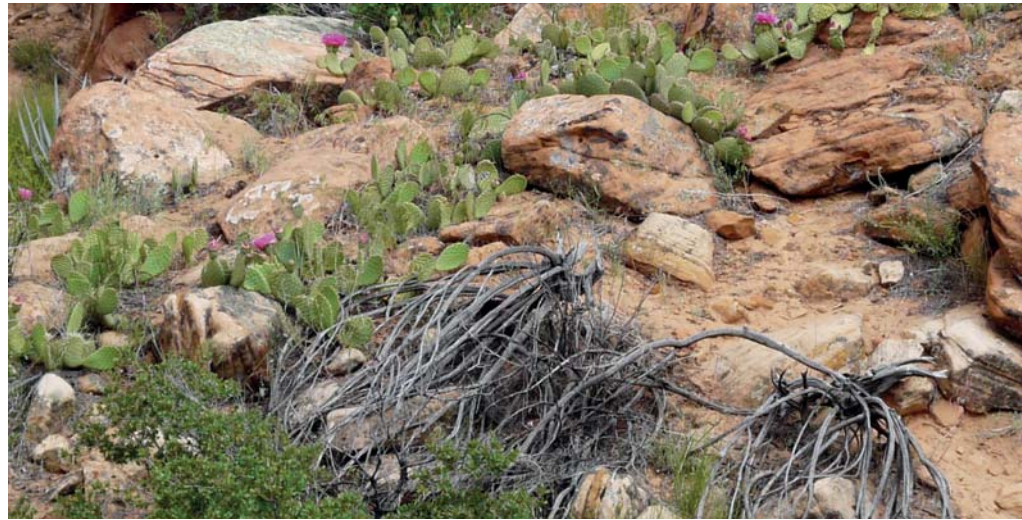
Während einer schweren Dürre versorgte Gott Elia mit Essen und Trinken

„Er handelt nicht mit uns nach unsern Sünden und vergilt uns nicht nach unserm Missetat. Denn so hoch der Himmel über der Erde ist, lässt er seine Gnade walten über denen, die ihn fürchten.“